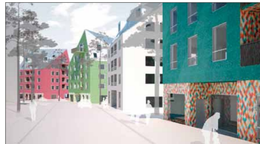
Gatuperspektiv längs Saltvägen (Byggestal/Backhans och Hahn Arkitekter) enligt förslaget i start-PM.

Det finns också ett förslag på ny bebyggelse mellan Saltvägen och tunnelba-